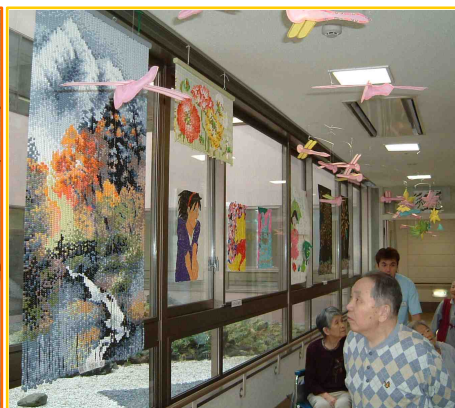
介護老人保健施設 白樺荘